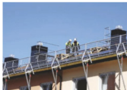
Du bör helst inte lida av svindel för att jobba med solcellsmontering.