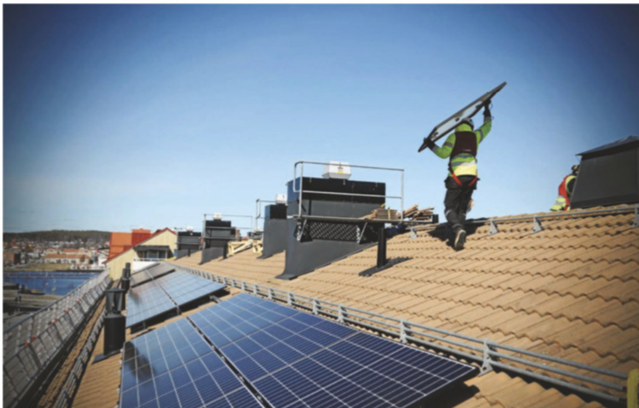
Investeringen är bra för både miljö och ekonomin anser föreningen.